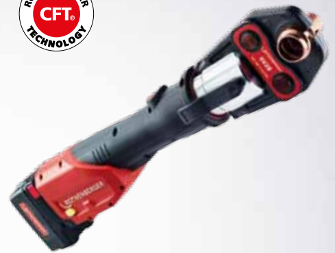
ROMAX 4000 18V/4Ah baterija, punjač ROCASE kofer No. 1000001840

Cena 1169,95 EUR Cena sa PDV 1403,94 EUR RG1