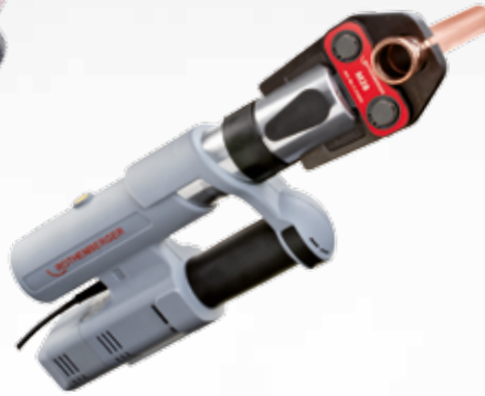
ROMAX AC ECO ROCASE kofer No. 15705

Cena 1089,95 EUR Cena sa PDV 1307,94 EUR RG1