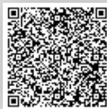
Romax Compact TT Brošura