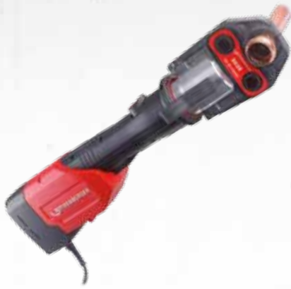
ROMAX 3000 AC, ROCASE kofer No. 1000001001

Cena 1089,95 EUR Cena sa PDV 1307,94 EUR RG1